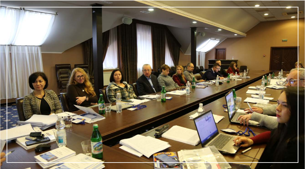
IV Стратегічний форум «Майбутнє Криму», 27 листопада – 01 грудня 2024

З заходів плану найбільш конкретизованим та, відповідно, й реалізованим, став захід щодо проведення безпекового форуму Кримської платформи, а ось питання її Міжнародної експертної мережі (далі – МЕМ) та загального виміру розвитку співпраці виписані доволі абстрактно, що ускладнює визначення ефективності виконання. Варто додати, що Мінреінтеграції України, відповідальне за звітування щодо виконання плану, не оприлюднило подібну інформацію щодо описаних вище пунктів. У виявленому в відкритому доступі стислому інформуванні Мінреінтеграції України про виконання Стратегії та плану як ключове досягнення вказувалося «забезпечення розробки і схвалення» двох «кримських» резолюції Генеральної Асамблеї ООН (далі – ГА ООН), а саме 76/70 та 76/179 [29].