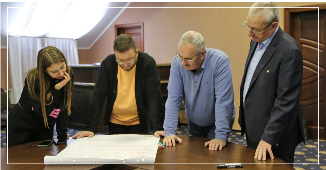
IV Стратегічний форум «Майбутнє Криму», 27 листопада – 01 грудня 2024

Прикладом, Спільна декларація Учасників МКП від 23 серпня 2021 р., заявляє про створення МКП як «консультативного і координаційного формату з метою мирного припинення тимчасової окупації РФ території АР Крим та міста Севастополя і для відновлення контролю України над цією територією у повній відповідності до міжнародного права».