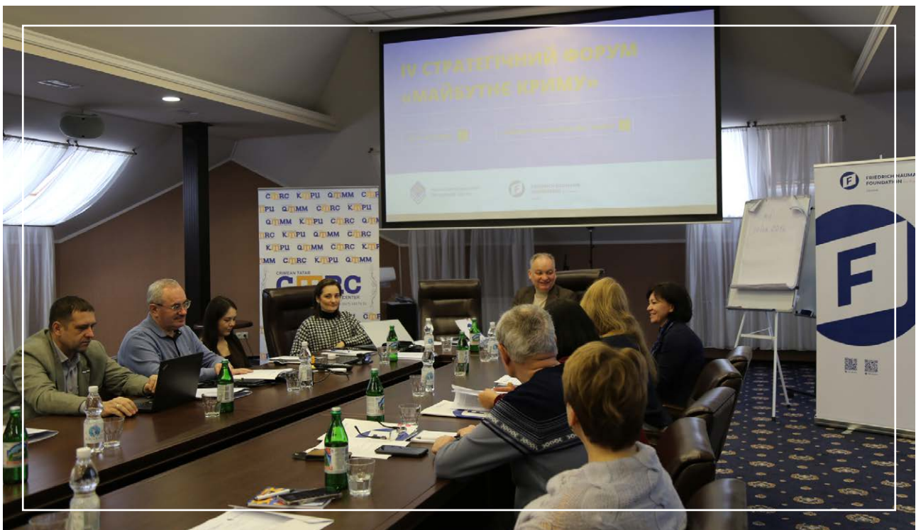
IV Стратегічний форум «Майбутнє Криму», 27 листопада – 01 грудня 2024

Практично аналогічне формулювання містилося у наступних щорічних резолюціях ГА ООН з подібною назвою, а саме у пункті 12 резолюції 77/229 від 15 грудня 2022 р. [43] та в пункті 12 резолюції 78/221 ГА ООН від 19 грудня 2023 р. «Ситуація з правами людини на тимчасово окупованих територіях України, включаючи Автономну Республіку Крим та місто Севастополь» [44]. Та водночас аналогічне формулювання міститься й у пункті 12 проекту аналогічної резолюції 2024 року [45], що означає достатню сталість відповідного механізму.