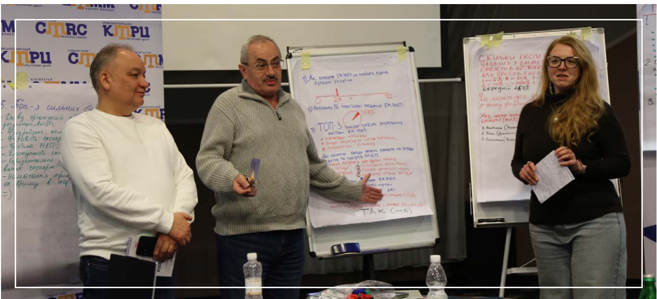
IV Стратегічний форум «Майбутнє Криму», 27 листопада – 01 грудня 2024

Надалі згадку про МКП містило Звернення ВРУ до урядів та парламентів іноземних держав, міжнародних організацій, парламентських асамблей у зв'язку з 80-ми роко-