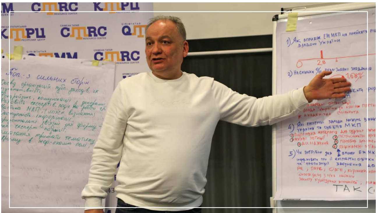
IV Стратегічний форум «Майбутнє Криму», 27 листопада – 01 грудня 2024