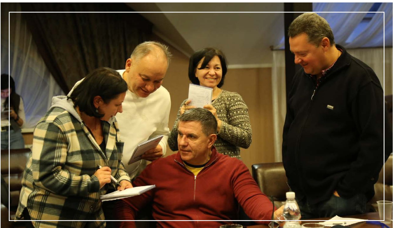
IV Стратегічний форум «Майбутнє Криму», 27 листопада – 01 грудня 2024

Загалом відображення діяльності Міжнародної Кримської платформи у джерелах міжнародного права залишається вкрай епізодичним.