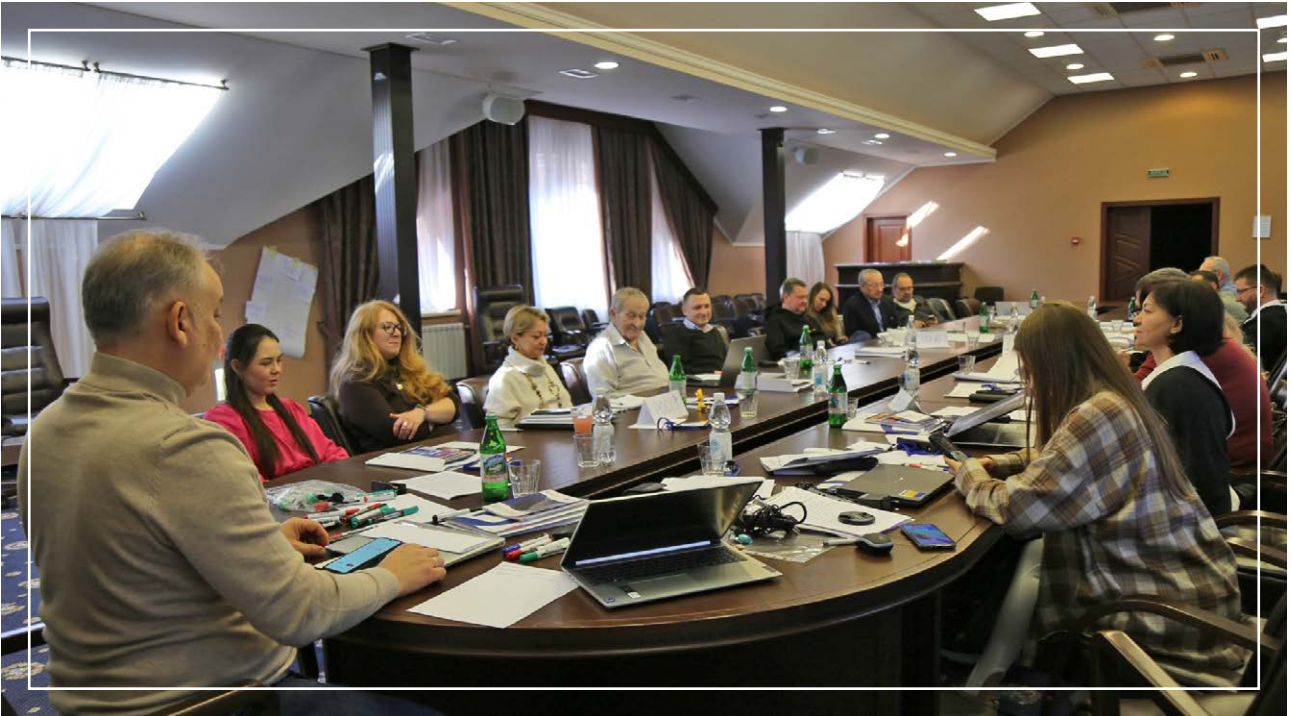
IV Стратегічний форум «Майбутнє Криму», 27 листопада – 01 грудня 2024