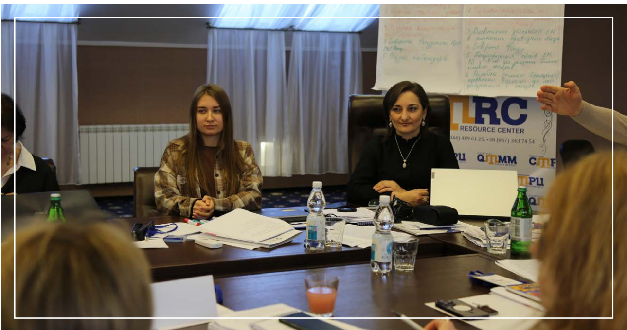
IV Стратегічний форум «Майбутнє Криму», 27 листопада – 01 грудня 2024