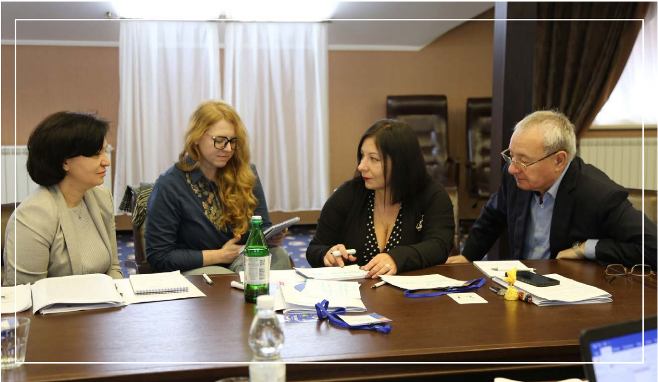
IV Стратегічний форум «Майбутнє Криму», 27 листопада – 01 грудня 2024

Також будь-які згадки про Кримську платформу відсутні у Порядку використання коштів, передбачених у державному бюджеті для забезпечення інформаційного суверенітету України, розвитку мов корінних народів, що проживають на ТОТ Криму, схваленому постановою КМУ від 10 березня 2021 р. № 201, як основного бюджетно-організаційного документу відповідного виміру [17].