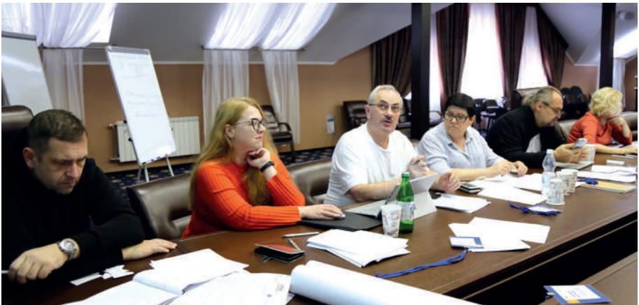
II Стратегічний форум «Майбутнє Криму», 31 жовтня - 5 листопада 2023

У цьому вимірі план підходить до деокупації, як до певного моменту, від якого, наприклад, вимірюється місяць, але формат встановлення такого моменту планом та іншими актами не визначено, при тому, що деокупація, як би вона не відбувалася, ймовірно, матиме не одномоментний, а розтягнутий у часі на доби, тижні та навіть місяці характер.