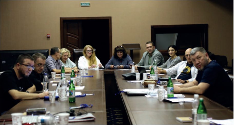
II Стратегічний форум «Майбутнє Криму», 31 жовтня - 5 листопада 2023