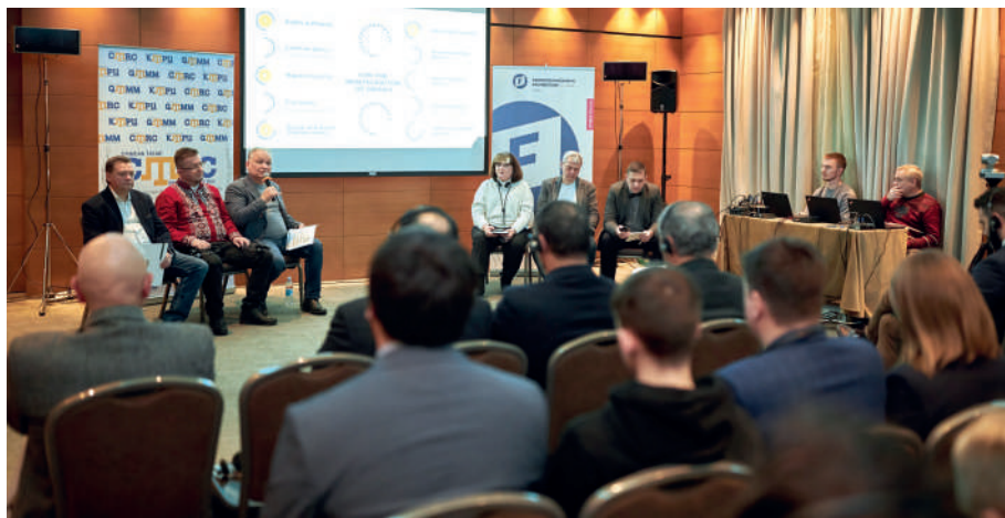
Презентація за результатами роботи II Стратегічного форуму «Майбутнє Криму» щодо реінтеграції Криму, 14 грудня, 2023