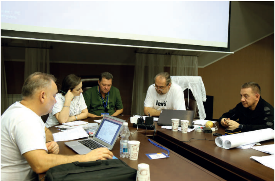
II Стратегічний форум «Майбутнє Криму», 31 жовтня - 5 листопада 2023

Питанням прав корінних народів присвячені такі акти уряду України 2023 року, як постанова КМУ від 6 січня 2023 р. № 19, якою було утворено Національну комісію з питань кримськотатарської мови, розпорядження КМУ від 28 липня 2023 р. № 657-р «Питання розроблення правопису кримськотатарської мови» та постанова КМУ від 19 серпня 2023 р. № 874, якою було змінено Порядок закріплення правового статусу представницького органу корінного народу України та позбавлення такого статусу.