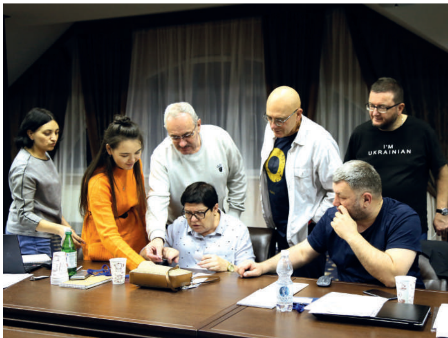
II Стратегічний форум «Майбутнє Криму», 31 жовтня - 5 листопада 2023

У 2022 році було схвалено парламентські заяви щодо засудження вчинення рф геноциду в Україні, спроби анексії ТОТ, визнання російського режиму терористичним, нелегітимності перебування росії в ООН, про морську агресію рф тощо.