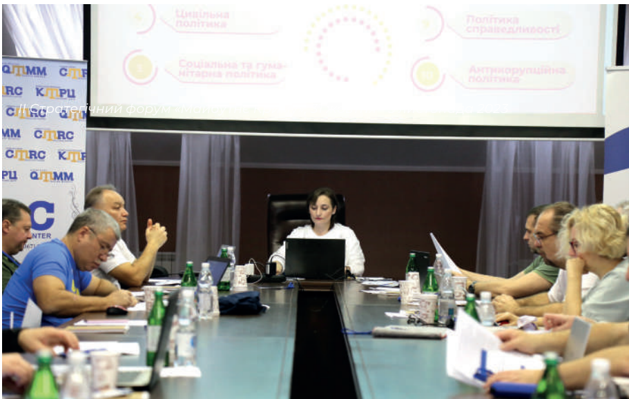
II Стратегічний форум «Майбутнє Криму», 31 жовтня - 5 листопада 2023

Додамо, що народні депутати, пов'язані з кримськотатарським корінним народом або із захистом прав корінних народів, не були включені у склад Тимчасової спеціальної комісії Верховної Ради України з питань підготовки проєкту основних засад державної політики України щодо взаємодії з національними рухами малих та корінних народів рф, утвореної постановою від 24 серпня 2023 р. № 3355-IX. Крім того, слід згадати й постанову Верховної Ради України від 3 травня 2023 р. № 3092-IX про вихід Верховної Ради України з Угоди про Міжпарламентську Асамблею держав-учасниць СНД.