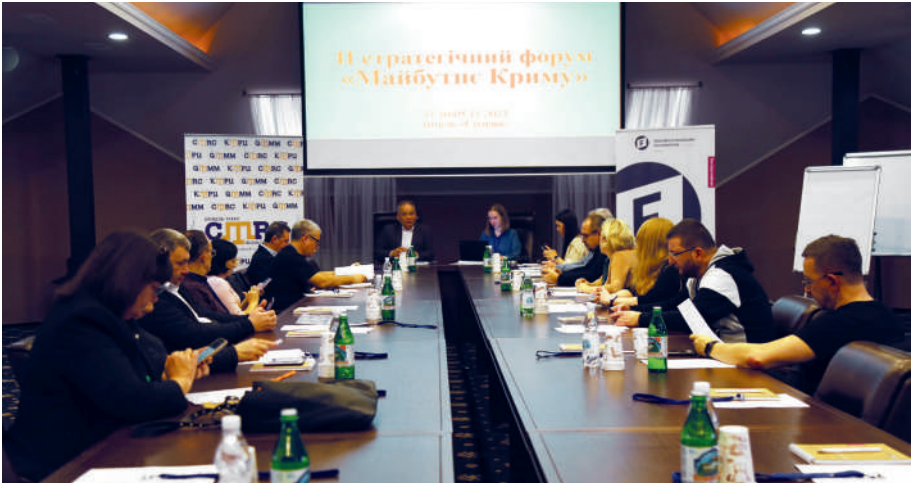
II Стратегічний форум «Майбутнє Криму», 31 жовтня - 5 листопада 2023

Ці документи мають системоутворювальний характер і стали правовим фундаментом політики України щодо російської агресії, ТОТ та ВПО, запровадили у вітчизняне право нові міжгалузеві інститути (військово-цивільні адміністрації, контрольні пункти в'їзду-виїзду тощо). Окремі інститути, а саме: режим «вільної економічної зони» на ТОТ у Криму та щодо «особливостей місцевого самоврядування» на ТОТ сходу України, не спричинили будь-які позитивні зміни, як у вимірі деокупації, так і реінтеграції, й у подальшому були скасовані.